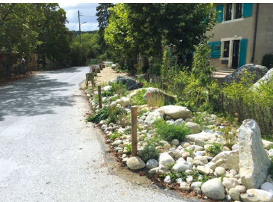
Rétrécissement de la route après les travaux

une prairie maigre et un mur en pierre sèche. Cette jolie clairière pourra donc à nouveau accueillir nos activités ainsi que celles de l'éco-crèche en forêt prochainement.