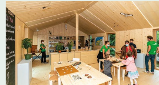
Intérieur du Centre durant l'inauguration (ci-dessus) et coupé du ruban (ci-contre)