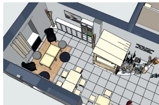
Maquette et début des travaux du nouvel accueil

Afin de pallier la fermeture du restaurant, une solution intermédiaire a été trouvée avec un traiteur local, spécialisé dans des produits de qualités, frais et locaux (Genève Région et Terre Avenir, GRTA). Dès l'assouplissement des règles en vigueur, un petit stand a été installé juste devant le centre avec des mets et boissons à emporter pour que les promeneurs puissent calmer faim et soif durant la belle saison.