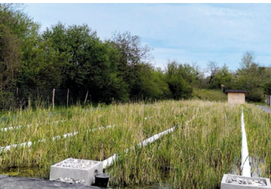
Nouvelle STEP à filtration par roseaux

En parallèle, l'État de Genève a mené une dépollution des mâchefers (résidus des déchets incinérés du canton) sur la parcelle lui appartenant et qui se trouve derrière le Centre Nature du Vallon de l'Allondon. La zone a été réaménagée avec des plantations d'arbres,