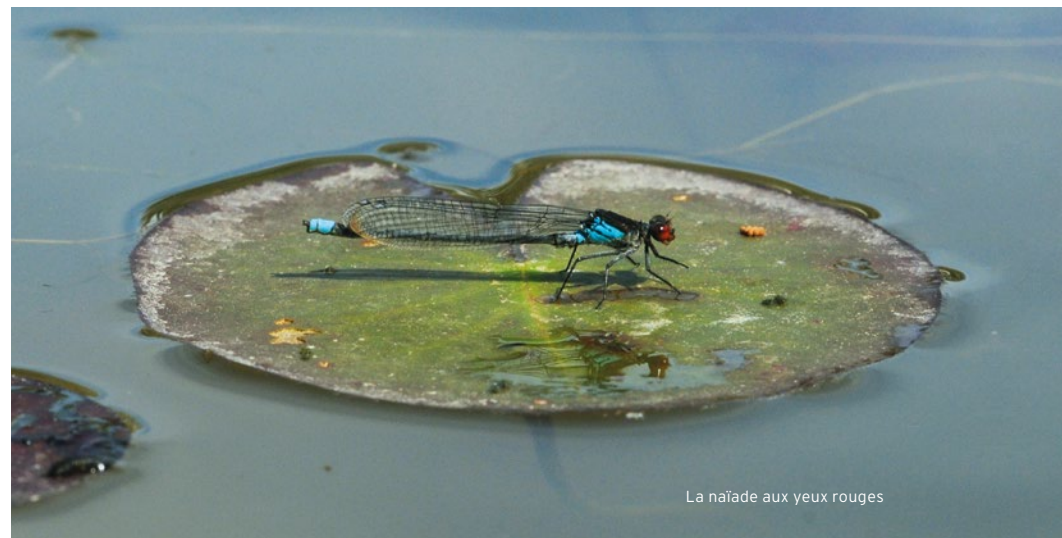
La naïade aux yeux rouges