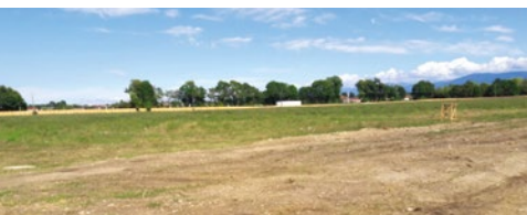
2 vues de la parcelle du futur centre

La collaboration avec la Plateforme Nature et Paysage Genève (www.pnpge.ch), créée en 2019, s'est intensifiée. Les 14 associations membres ont trouvé un rythme de croisière pour le fonctionnement concernant les projets d'aménagements du territoire. En effet, pour des petites structures, il est plus aisé de partager les études des différents projets. Profitant des expertises de chacune, les analyses gagnent en pertinence et en précision technique. La plateforme permet également une meilleure visibilité dans le paysage genevois et est devenue un véritable interlocuteur pour toutes ces questions.