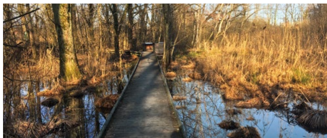
Platelage à Mategnin les Crêts

Finalement, l'ensemble des mesures courantes concernant l'entretien de nos réserves naturelles a pu être mené selon les plans de gestion habituels par une entreprise spécialisée. N'ayant pu organiser qu'une seule journée de volontariat cette année à la Pointe à la Bise, l'entreprise SITEL a ainsi pallié ce manque pour finaliser l'ensemble des mesures projetées. Nous en profitons pour remercier chaleureusement tous les collaborateurs de cette entreprise pour le travail accompli depuis plusieurs années.